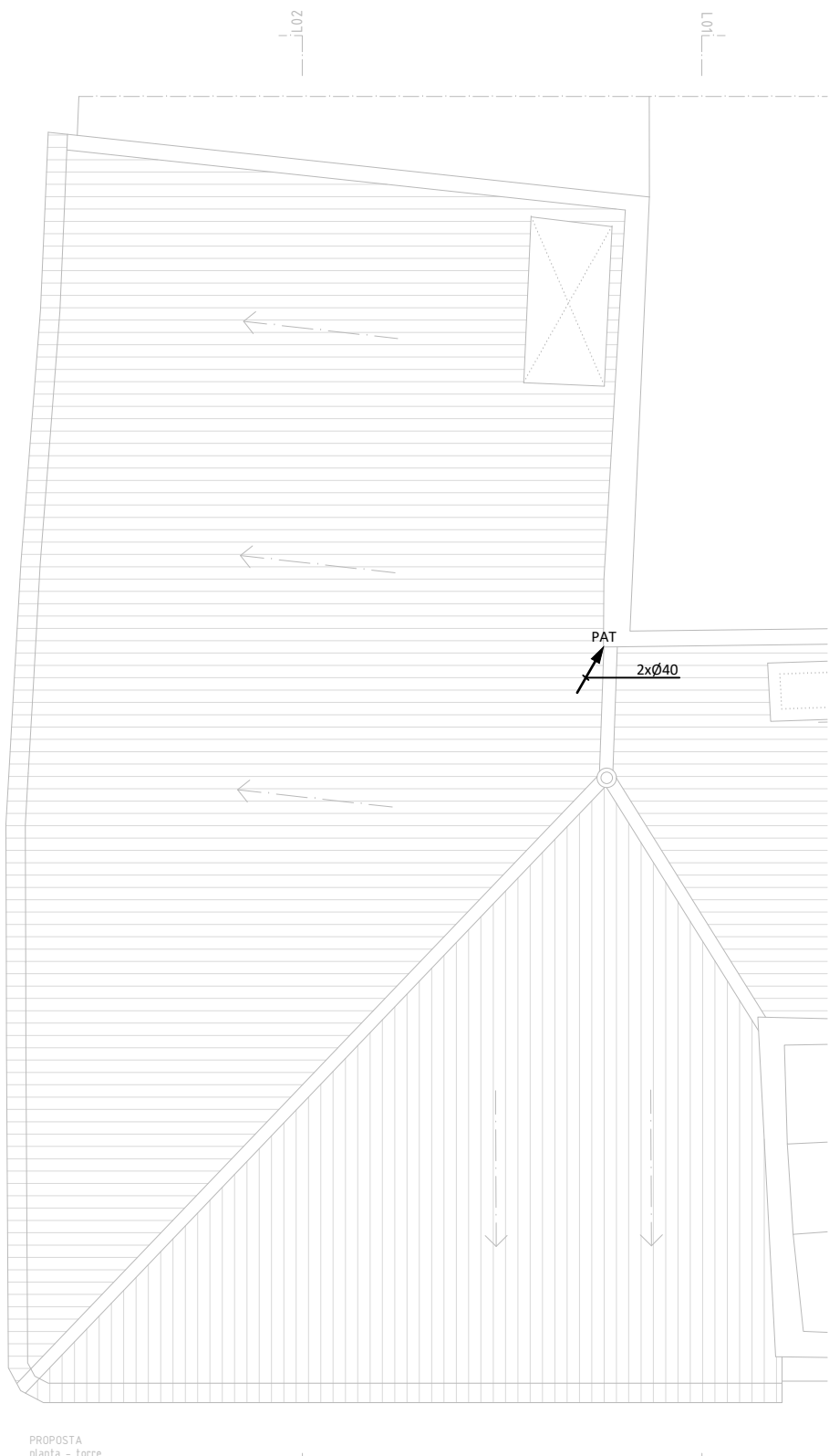
PROPOSTA planta - torre